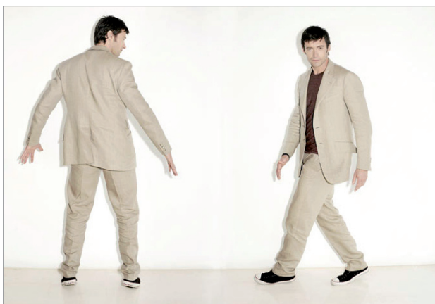
Figura Intera , la persona è inquadrata dai piedi alla testa e sta esattamente nell'inquadratura, il soggetto può stare in piedi o seduto l'importante che nessuna parte del corpo venga tagliata.

Il piano , in fotografia è un termine usato per indicare l'ampiezza della inquadratura in rapporto alla figura umana. Quando le inquadrature sono molto ampie si parlerà di campi , dove la figura umana acquista minore importanza e lo spazio intorno ad esso fa da protagonista. A seconda della porzione di figura umana inquadrata, il piano assume diciture diverse: figura intera, piano americano, piano medio, primo piano e primissimo . Restringendo l'inquadratura su di un singolo particolare si ottiene il dettaglio .